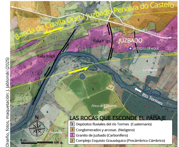
Diseño, fotos, maquetación: J. Jablonski (2025)

En Juzbado contamos con un lugar de interés geológico (L.I.G.) Está ubicado y señalizado cerca del museo y allí podrás leer un panel informativo con todos los detalles más relevantes acerca de los granitos cizallados de Juzbado.