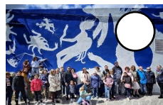
SIN TÍTULO David de la Mano