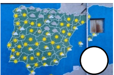
UN MAPA DEL TIEMPO IBÉRICO Amparito