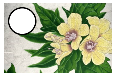
REFORESTANDO HYOSCYAMUS NIGER Doa