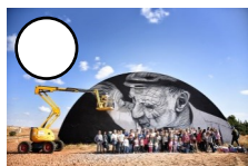
EL BESO Artesprada