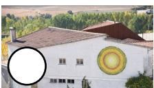
DETALLE DE UN TALLO Teresa Suk_art