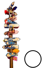
ROSA DE LOS VIENTOS Infancia de Juzbado Coord. Montserrat G.