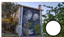
SECRETO IBÉRICO