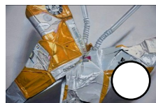
BUTTER BRIK Dadospuncero