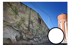
SETA DE CARDO SEA 162