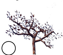
ÁRBOL DEL TIEMPO Fernando Sánchez Blanco VVAA