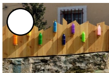
BOTELLAS DE COLORES Jesús G. Bautista